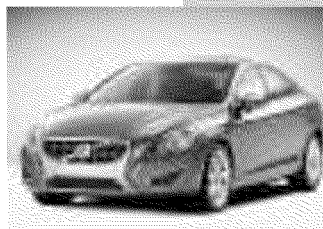
Volvo S60 costruita per stupire

BOLOGNA. Sono state diffuse le prime foto ufficiali della nuova Volvo S60. «Questa vettura - ha detto Stephen Odell, presidente e Ceo di Volvo Cars - è fatta per suscitare emozioni forti. La linea e il