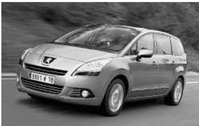
Peugeot 5008 è dotato di un enorme bagagliaio

sono abbastanza rigide per una maggior tenuta di strada pur mantenendo un grande comfort di marcia. Molto comodo il posto di guida. I prezzi del nuovo monovolume 5008 vanno da 21 a 30 mila euro. (b.t.)