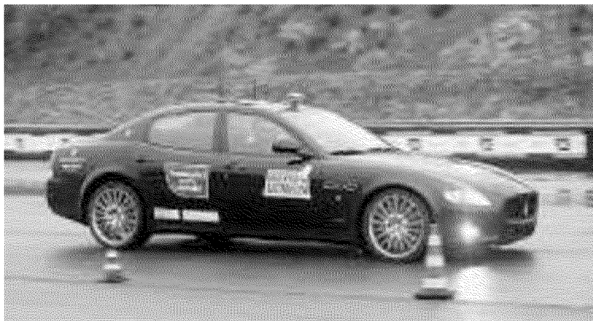
Test di frenata sull'asfalto umido e freddo sul circuito di Varano

Francoforte, si sono ora trasformate in 6 ordini per la versione Black Yearling. Questa serie è già disponibile in 100 esemplari: cliccando sul banner presente sul sito www.peugeot.it o sull'area dedicata www.rczblackyearling.it è possibile prenotarla per entrare in possesso, in primavera, dell'esclusiva RCZ. Offerta con due motorizzazioni (1.6 da 156 cavalli e 2.0 Hdi Fap da 163 cavalli) la nuova serie speciale limitata e numerata, ha una denominazione che riflette il suo spirito da purosangue. Il termine «Yearling», infatti, identifica i giovani promettenti cavalli, prossimi al debutto nel mondo delle corse ippiche. I prezzi, chiavi in mano: versione 1.6 Thp, 32.000 euro; versione 2.0 Hdi Fap, 35.000 euro.